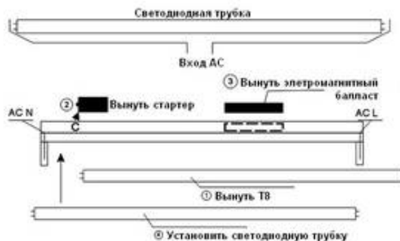
Схема замены лампы

Архангельск (8182)63-90-72 Астана (7172)727-132 Астрахань (8512)99-46-04 Барнаул (3852)73-04-60 Белгород (4722)40-23-64 Брянск (4832)59-03-52 Владивосток (423)249-28-31 Волгоград (844)278-03-48 Вологда (8172)26-41-59 Воронеж (473)204-51-73 Екатеринбург (343)384-55-89 Иваново (4932)77-34-06